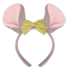
くんちゃんカチューシャ