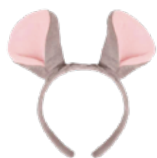
とっくんカチューシャ

・カチューシャ・人形はほつれや汚れ、破損がないかご確認ください。 ・トラックは汚れや部品の損失がないかご確認ください。