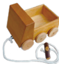
とっくんトラック