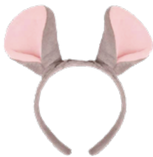
とっくんカチューシャ