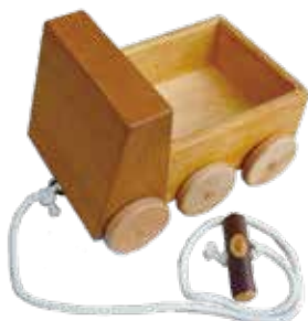
とっくんトラック