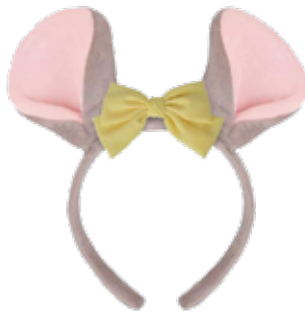
くんちゃんカチューシャ